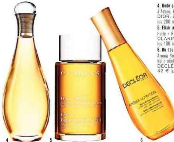
4. Onde sensuelle. J'Adore, Huile divine, DIOR, 81,50 € les 200 ml. 5. Elixir apaisant. Huile « Relax », CLARINS, 52 € les 100 ml. 6. Du baume au corps. Aroma Nutrition, huile sèche satinante, DECLÉOR, 42 € les 100 ml.

institut : pas uniquement un enchaînement de gestes mécaniques, sans âme, mais une réelle connexion. « Je suis persuadée que le toucher est un sens beaucoup trop négligé, alors qu'il est une des clefs du bien-être et, je dirais même, de la santé. Aujourd'hui, la médecine occidentale reconnaît qu'après une opération ou une chimiothérapie, par exemple, les thérapies manuelles sont très importantes pour apprendre à se réapproprier son corps », ajoute Elisabeth Nado.