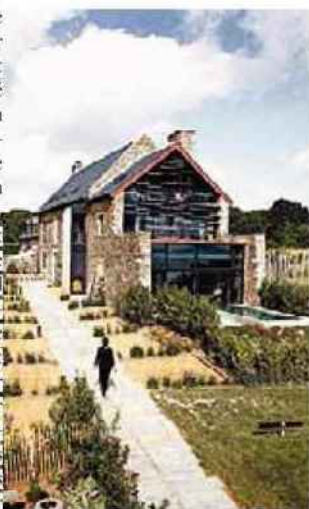
Un hébergement très singulier : d'anciens corps de ferme abritant des KLEDS – « abrités du vent », en breton – dans des matériaux bruts.

Imaginez un large champ descendant en PENTE DOUCE vers la baie, et cette VUE superbe avec le MONT-SAINT-MICHEL en point de mire