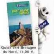
Guide vert Bretagne du Nord, 14,90 €.

Breizh Café L'adresse incontournable sur le port de Caneale. Au rez-de-chaussée, une crêperie et, à l'étage, la table gastronomique du chef japonais Raphaël-Fumio Kudaka. 7, quai Thomas, 02-99-89-61-76. Menus de 38 à 135 €.