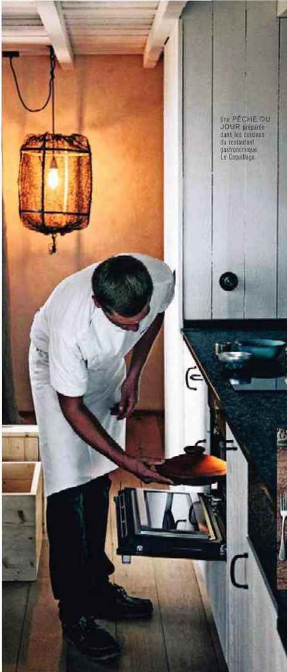
Une PÊCHE DU JOUR préparée dans les cuisines du restaurant gastronomique Le Coquillage.