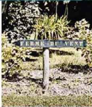
La sobriété de l'aménagement des kléds : du BOIS et de grosses PIERRES apparentes pour une ambiance rustico-chic.