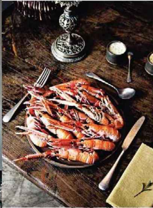
LANGOUSTINES aux deux mayonnaises - piments et algues - et SAINT-PIERRE dans sa nage au safran de Bretagne et curcuma des Indes. Savoureux.